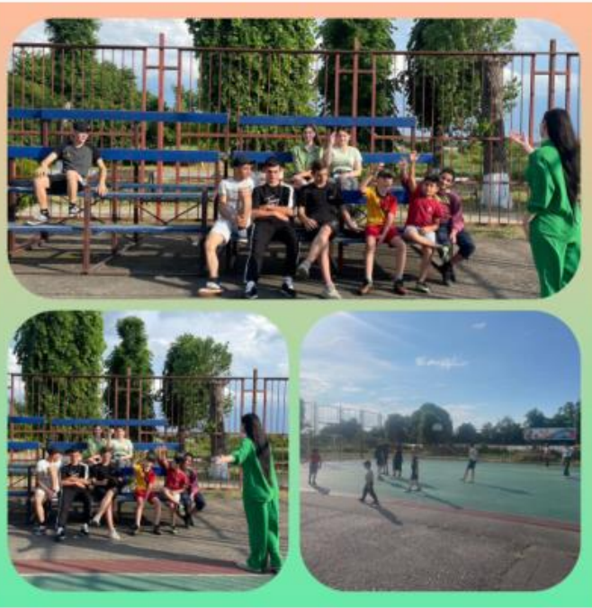
Флешмоб «Мы дети Кубани!»