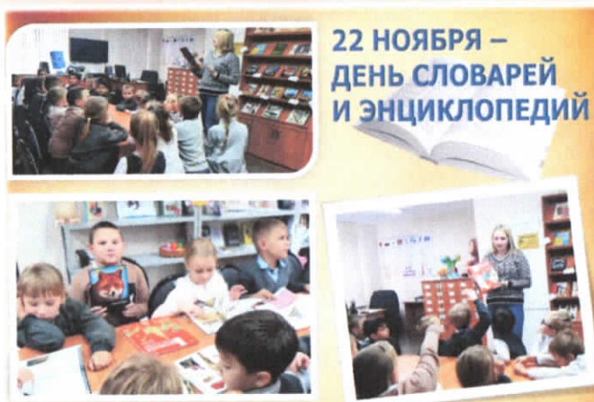
22 НОЯБРЯ – ДЕНЬ СЛОВАРЕЙ И ЭНЦИКЛОПЕДИЙ

22 ноября Долгогусевская сельская библиотека открыла свои двери для учеников первого класса МОУ ООШ № 15 п. Верхневеденеевского и провела библиотечный урок "Книги, которые знают все", посвященный Дню словарей и энциклопедий. Ребята познакомились поближе с библиотекой и узнали много нового о книгах, а особенно о словарях и энциклопедиях. Еще для ребят библиотекари подготовили книжную выставку, на которой подобраны очень яркие и красивые словари и энциклопедии. Также, ребята узнали, как нужно беречь книгу, ведь она самый лучший друг!