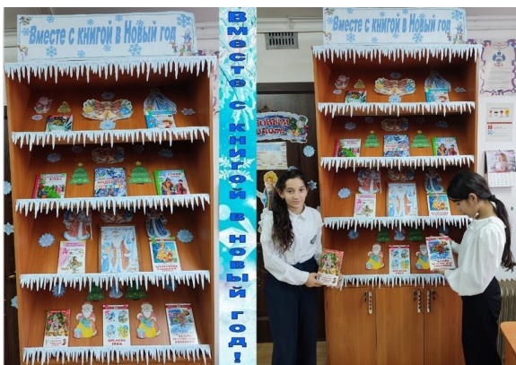
В ожидании Нового года Друженской сельской

На выставке представлены как давно известные и любимые всеми истории, например «Морозко», «Снегурочка», «Двенадцать месяцев», так и новые рассказы и сказки русских и зарубежных писателей. Сказки, полные добра и волшебства, будут самым желанным чтением в ожидании Нового года!