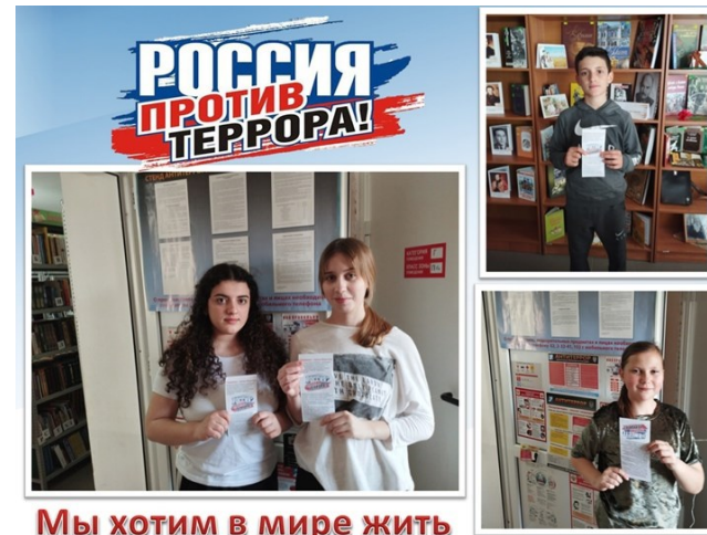
Мы хотим в мире жить

21 марта сотрудники Долгогусевской сельской библиотеки распространили буклет «Мы хотим в мире жить». В рамках противодействия экстремизму, терроризму. В буклете рассказано об общих правилах безопасности, так же о том что терроризм не признает ни религиозных, ни национальных, ни государственных границ.